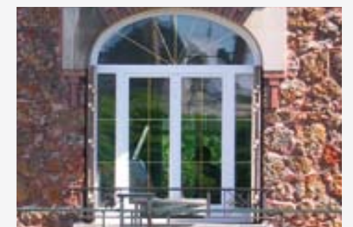
Altbausaniierung, Schweiz: Stil und Charakter der Fassade und des Fensters bleiben voll erhalten.